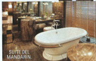
SUITE DEL MANDARIN.